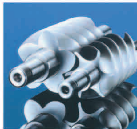
康普艾螺杆线形——持续研发的成果