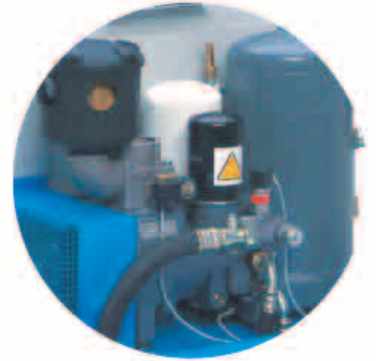
集成化的部件，便于维护

大气量压缩元件转速较低，配合经优化的注油效果，使得压缩机在具有最大可靠性条件下实现高效率。