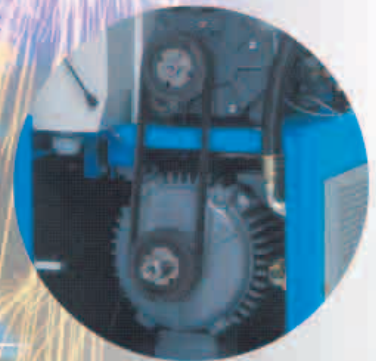
可靠高效的驱动系统