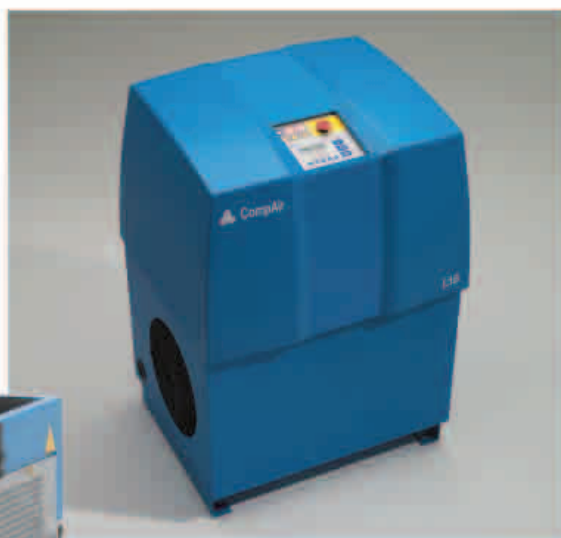
L15 - L22